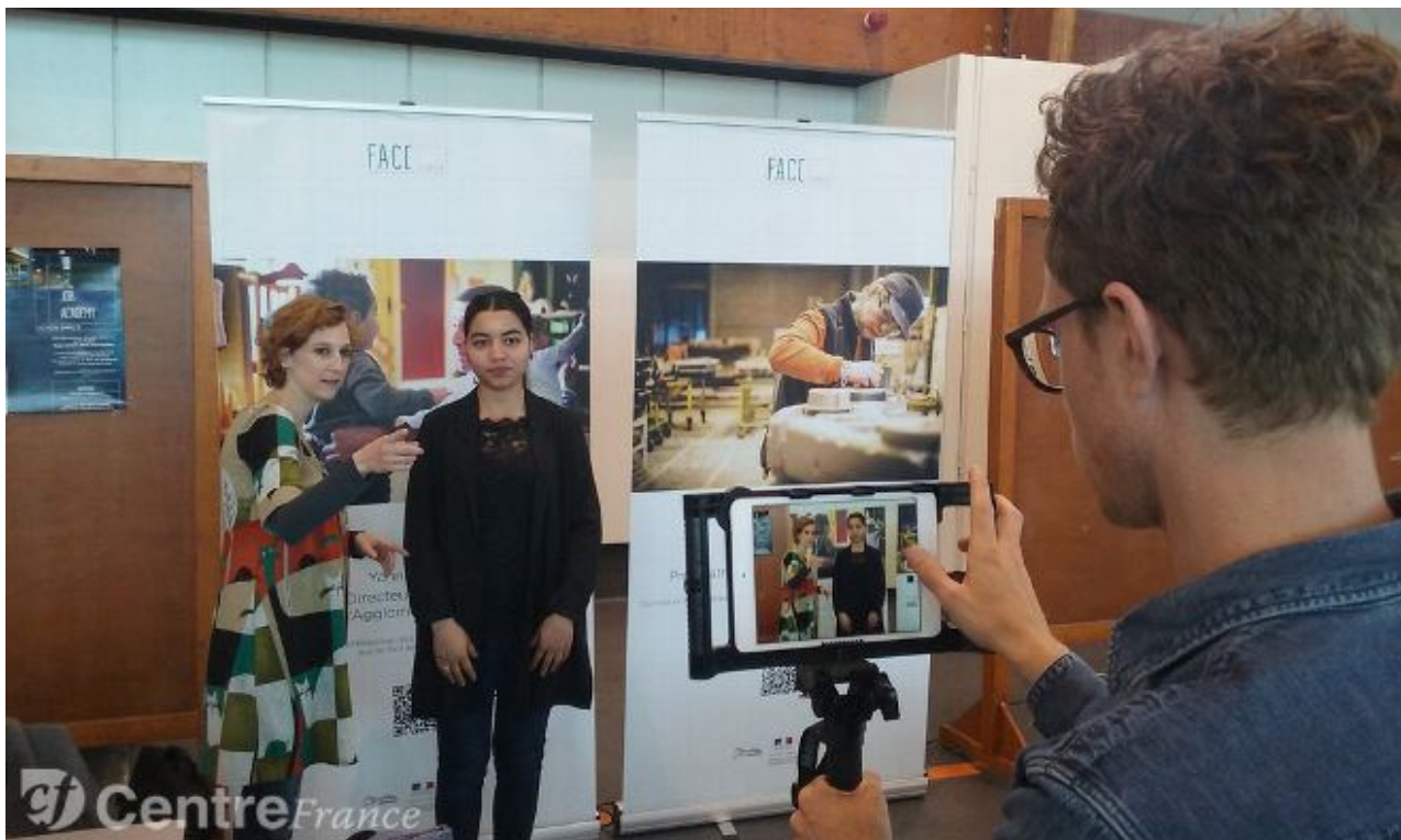
forum emploi atelier CV vidéo

À l'occasion du forum Emploi y'et moi organisé à Brive la semaine dernière, FACE Corrèze a animé des ateliers CV vidéo.